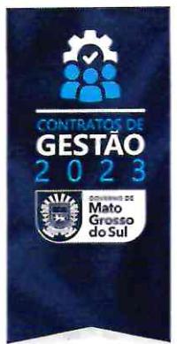
EDUARDO CORRÊA RIEDEL Governador do Estado de Mato Grosso do Sul