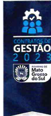
Tabela 2 – Entregas anuais do Contrato de Gestão 2023

e adotando as melhores práticas de gestão pública, devendo ao final do exercício ter realizado as entregas descritas na tabela 2, a seguir.